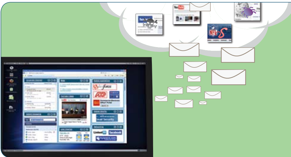
El uso de la web en los ataques de spam no para de crecer.

director de infraestructuras, Nelson Marlborough District Health Board